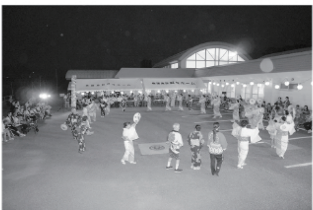
皆で踊って楽しかった