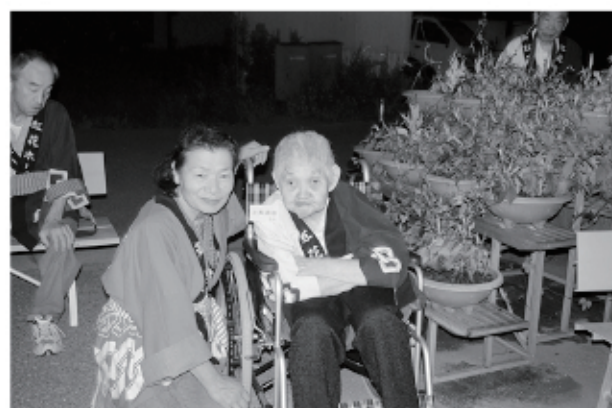
太鼓も、花火もいいな~(*^_^^)