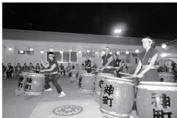
若木焰太鼓による迫力のある演奏

これからも利用者さんや地域の方々、参加して下さいる皆さんから紅花ホームの夏祭りは「すごくいい」「楽しかった」等の言葉を貰えるように企画していきたいと思えます。来年度は昨年以上に楽しんで頂きたいと思えます。