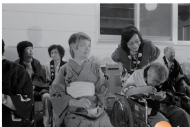
夏といえばかき氷