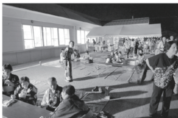
出店も賑わいました(*^。^^)