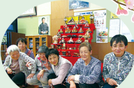
雑壇(と私たち) 綺麗に飾りました