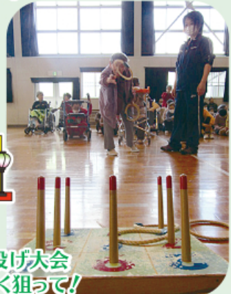
輪投げ大会 よ〜く狙って!