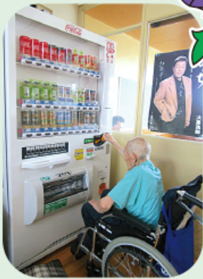
バリアフリー対応 New!自販機