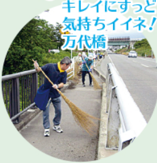
キレイにすっど 気持ちイネ! 万代橋