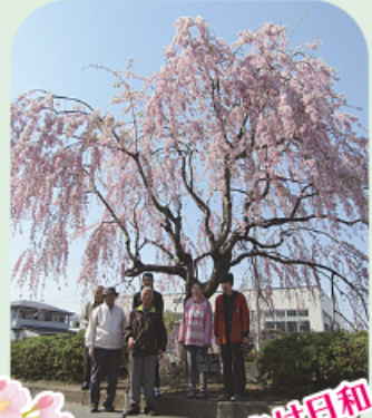
お出かけ日和 春を満喫中