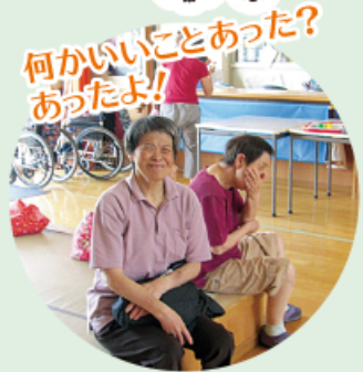
何かいいことあった? あったよ!