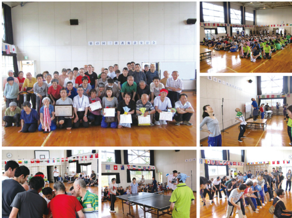
三救護施設交歓会 6/28 第1位 紅花ホーム 第2位 みやま荘 第3位 泉荘