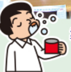
口腔ケアタオル 準備お世話様です