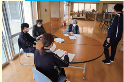
ワークシートで学びます