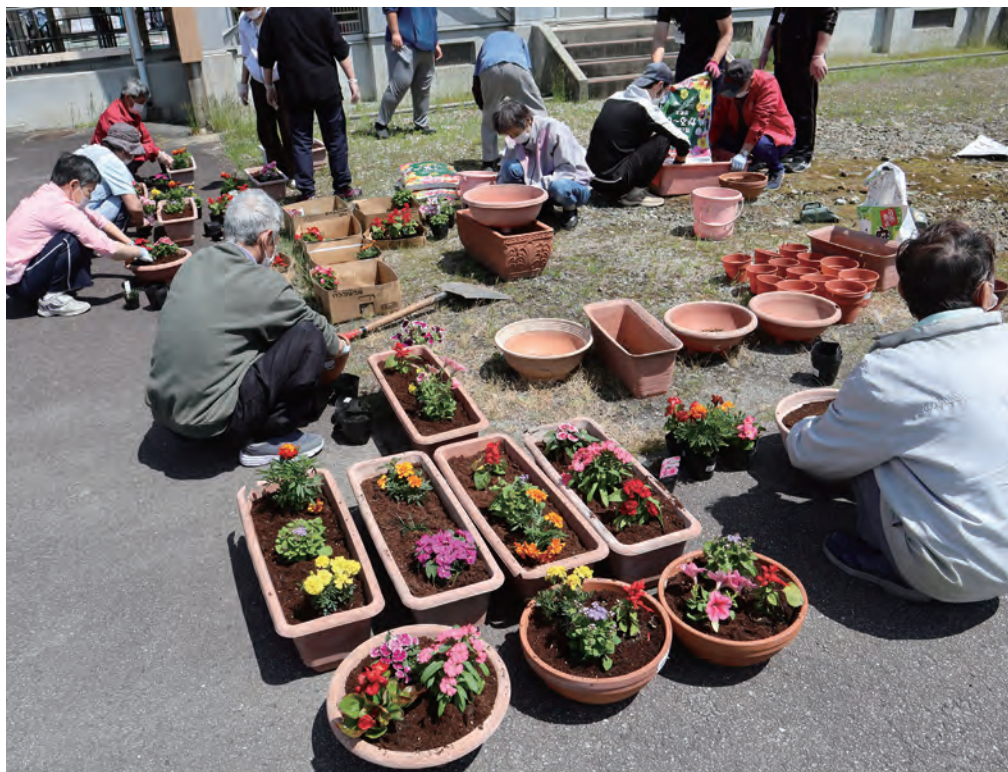
～紅花ホームを花いっぱいへ～