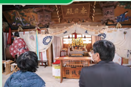
春日神社へ皆さんの 健康祈願へ行きました