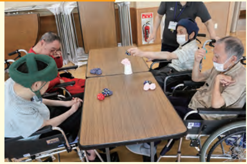
落ちないようにそとと・・・