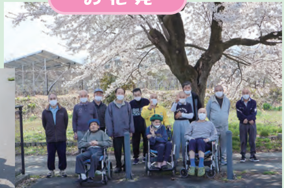
満開の桜。きれいだなー。