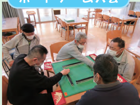
麻雀、オセロ、すごろく、 ゲームを楽しみました