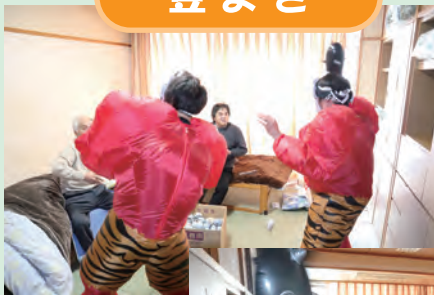
鬼が来たー。 鬼は外。福は内。