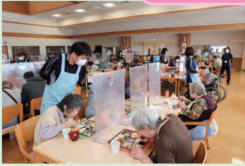
豪華な食事でお祝い