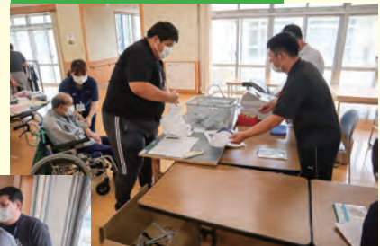
どれにしようかな